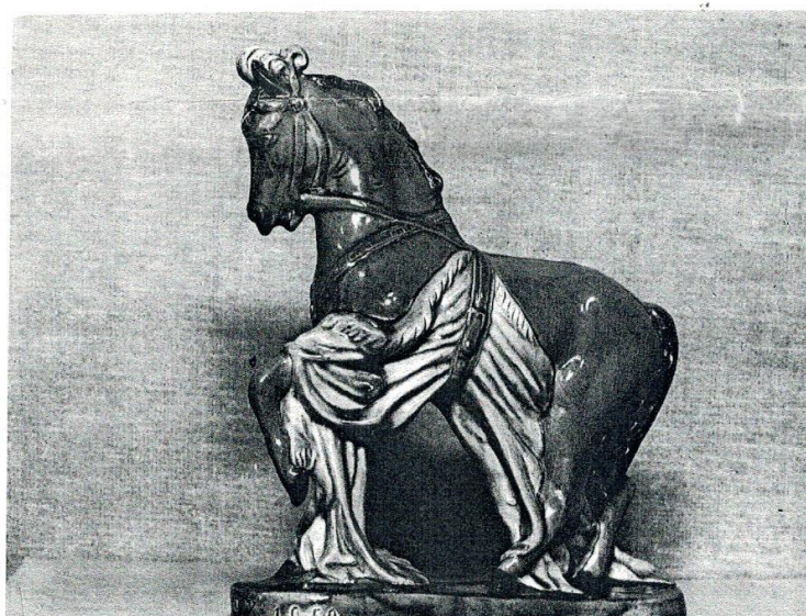
Рис. 8. Ф.Ф. Лях. Конь. Фаянс