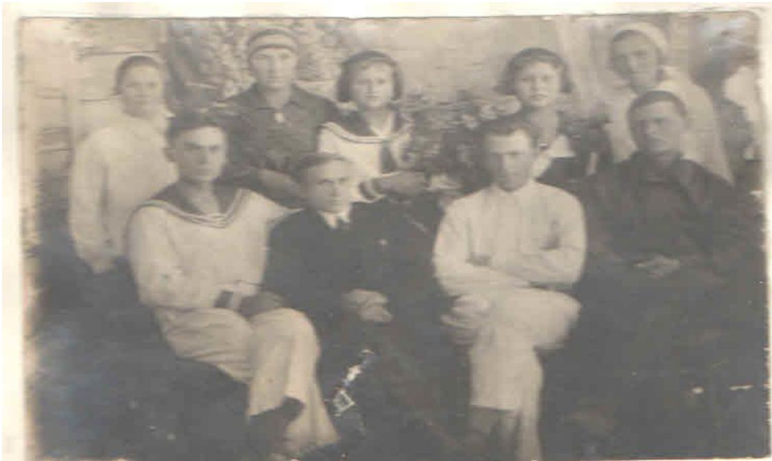
Рисунок 1. Учителя и работники школы в 1936 году