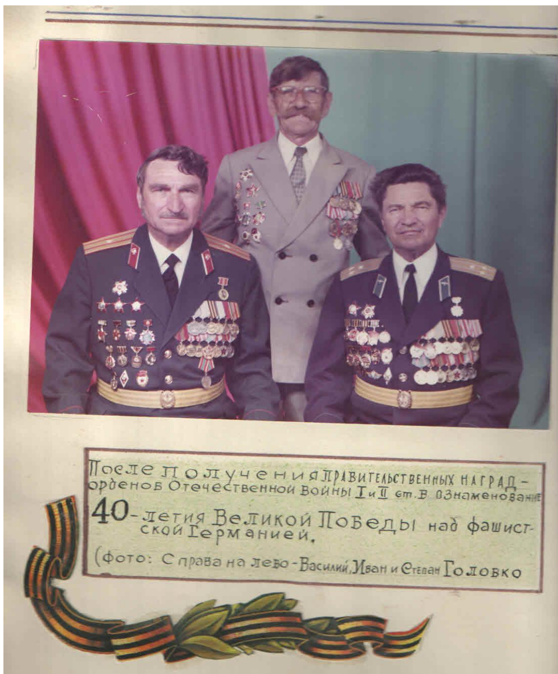
Рисунок 5. Братья Головки.