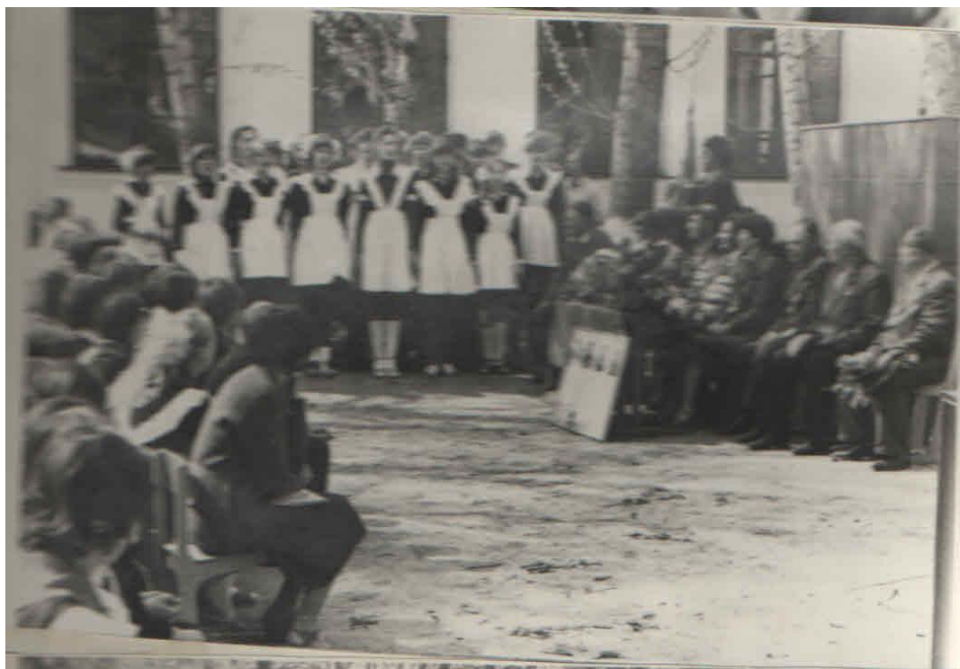
Рис. 1. «Урок Мужества» в родной школе.