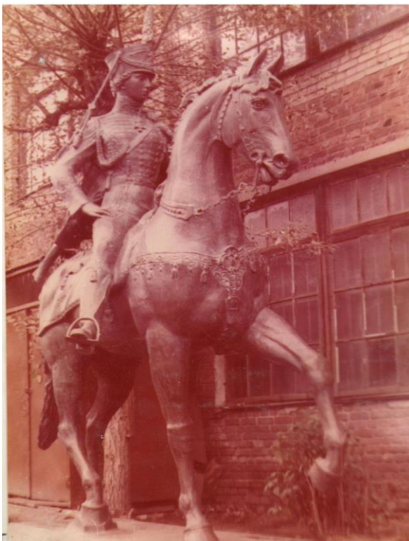
Рисунок 2. Скульптура «Русская Амазонка»