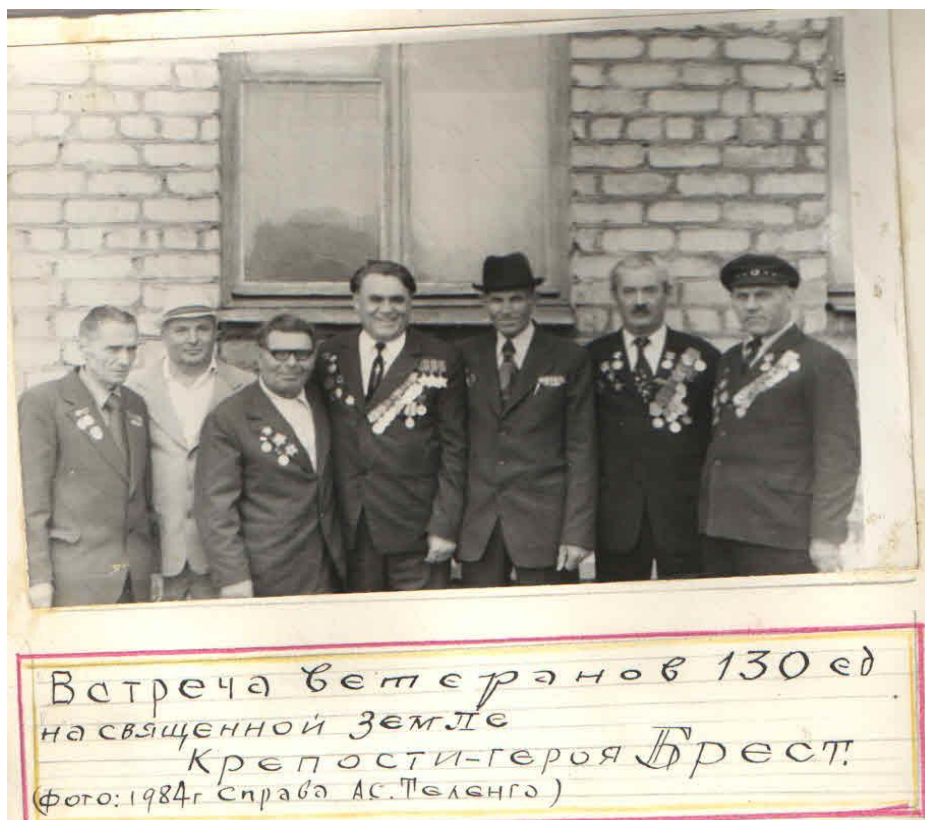
Рис.1. Ветераны на местах боёв.