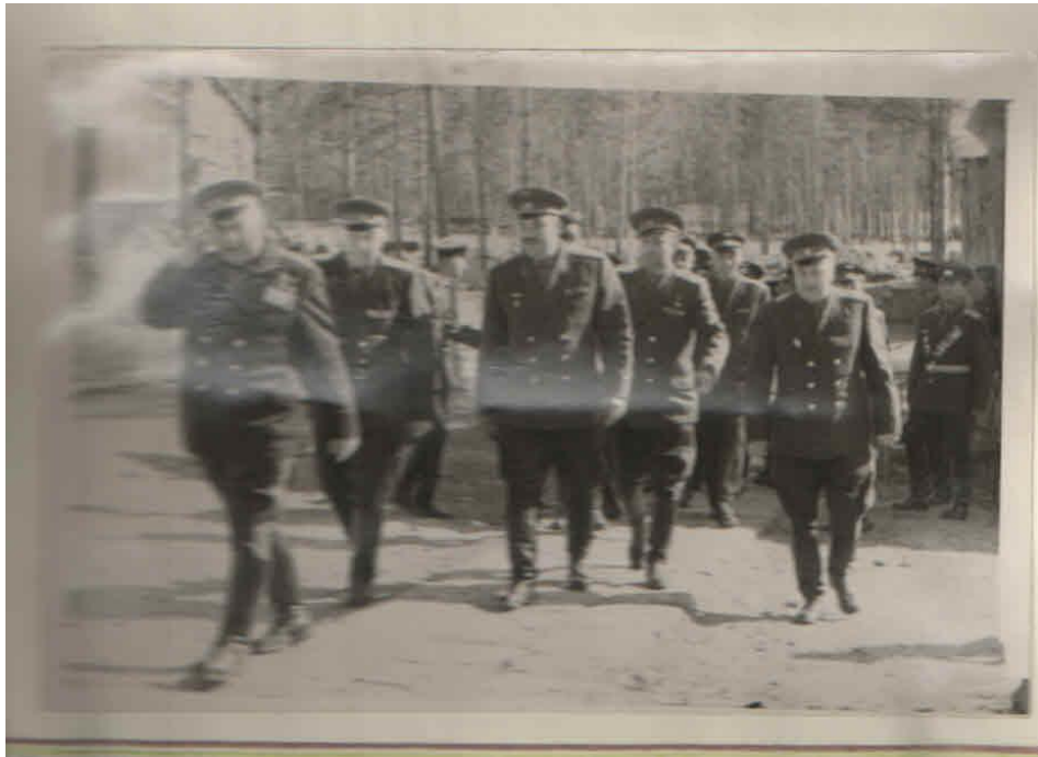
Рис. 1. Маршал Советского Союза Крылов Н.И. во главе Военного Совета покидает военный городок, где базировался полк под командованием полковника Головки В.А.