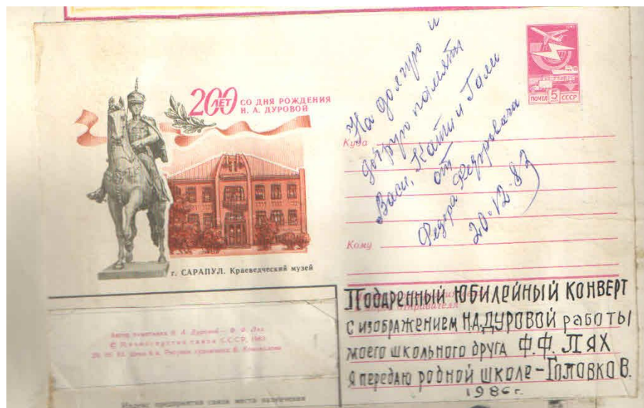
Рисунок 3. Скульптура «Русская Амазонка» на конверте.